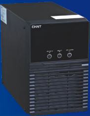
塔式机：HP-UPS-1kVA(L) HP-UPS-2kVA(L) HP-UPS-3kVA(L)