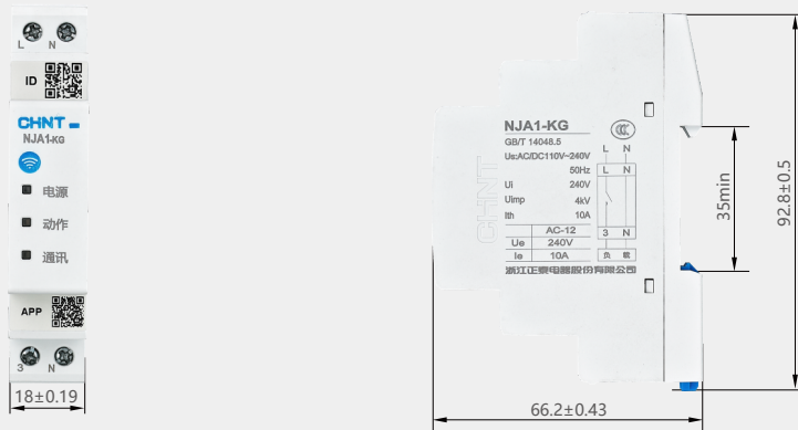
图 2 NJA1-KG