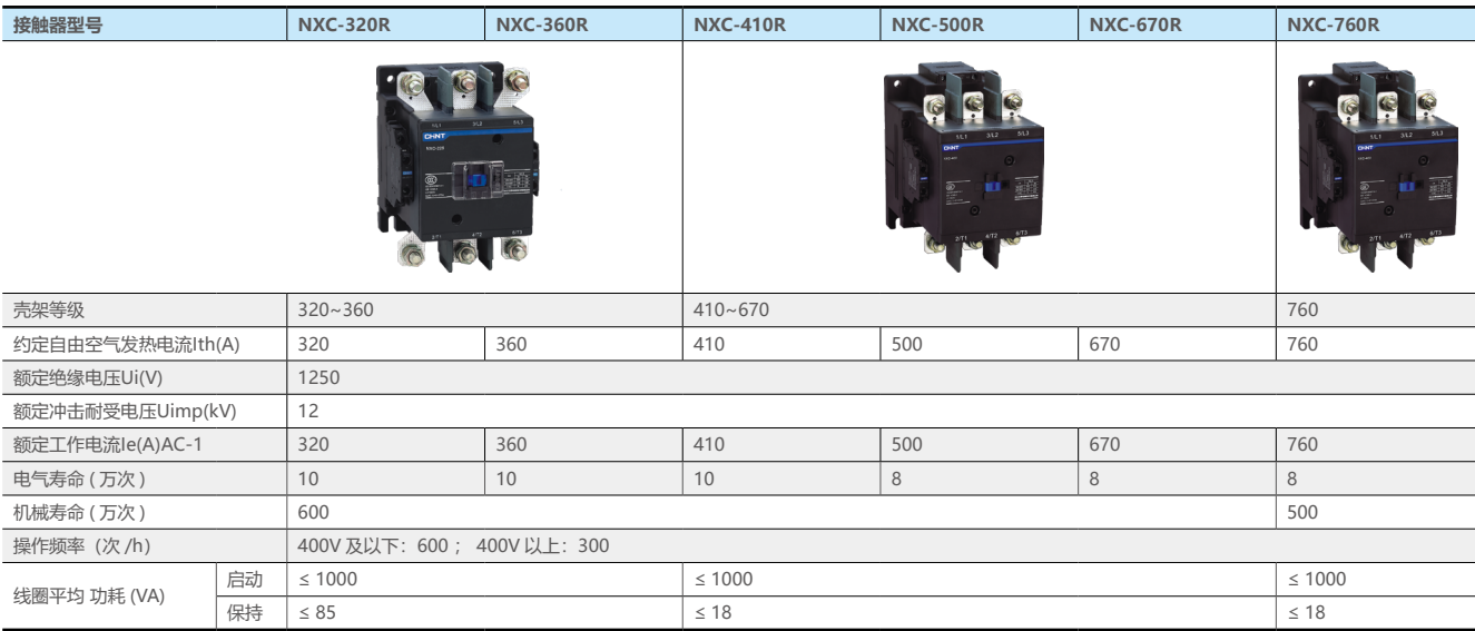
NXC-320R~760R 外形尺寸与安装尺寸