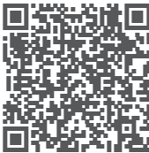
正泰电器客户服务

地址：浙江省乐清市北白象镇正泰工业园区正泰路 1 号 邮编：325603 电话：0577-62877777 传真：0577-62875888