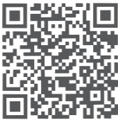
正泰电器微信公众号