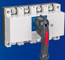
NH43 -200/4 -250/4