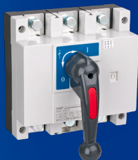
NH43 -500/3 -630/3