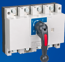
NH43 -500/4 -630/4